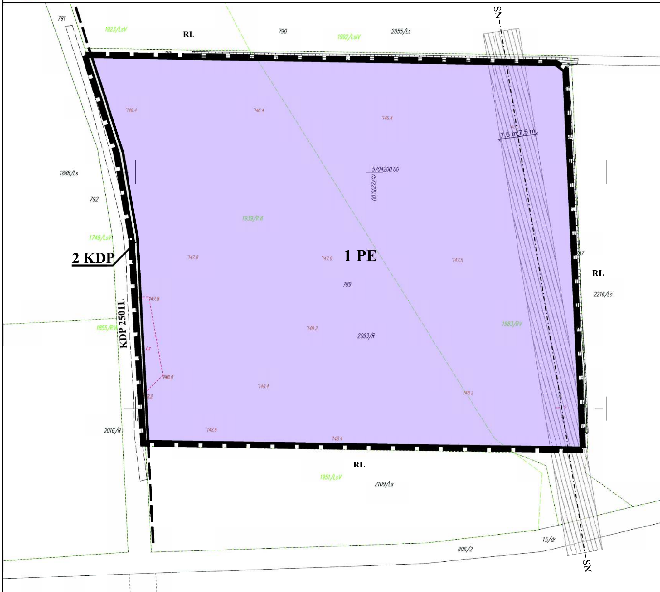
WYRYS ZE RYSUNKU STUDIUM UWARUNKWAŃ I KIERUNKÓW ZAGOSPODAROWANIA GMINY ŻYRZYN SKALA 1 : 10 000