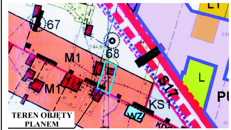
TEREN OBJĘTY PLANEM

WYRYS Z RYSUNKU STUDIUM UWARUNKOWAŃ I KIERUNKÓW ZAGOSPODAROWANIA PRZESTRZENNEGO GMINY ŻYRZYN PRZYJĘTEGO UCHWAŁĄ NR XXII/138/2013 RADY GMINY ŻYRZYN Z DNIA 21 SIERPNI 2013 r. Z PÓŹN. ZM. SKALA 1 : 10 000