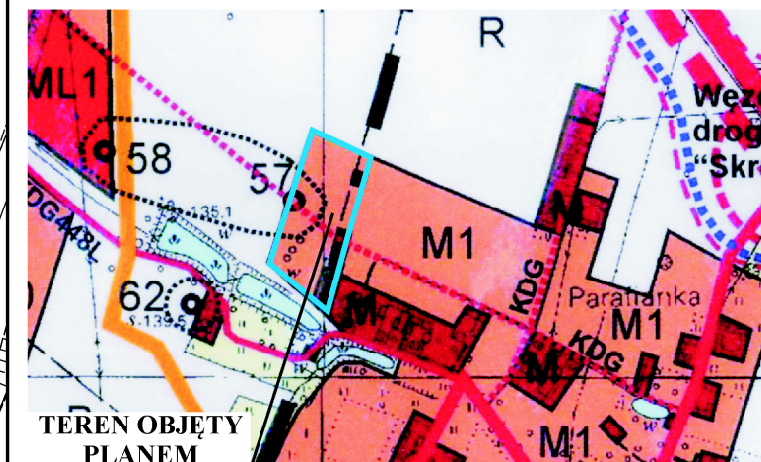
TEREN OBJĘTY PLANEM

WYRYS Z RYSUNKU STUDIUM UWARUNKWAŃ I KIERUNKÓW ZAGOSPODAROWANIA PRZESTRZENNEGO GMINY ŻYRZYN PRZYJĘTEGO UCHWAŁĄ NR XXII/138/2013 RADY GMINY ŻYRZYN Z DNIA 21 SIERPNI 2013 r. Z PÓŹN. ZM. SKALA 1 : 10 000