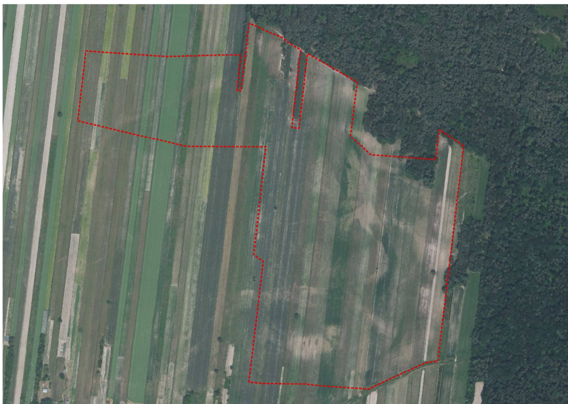
Ryc. 4 Obszar opracowania w miejscowości Wola Osińska