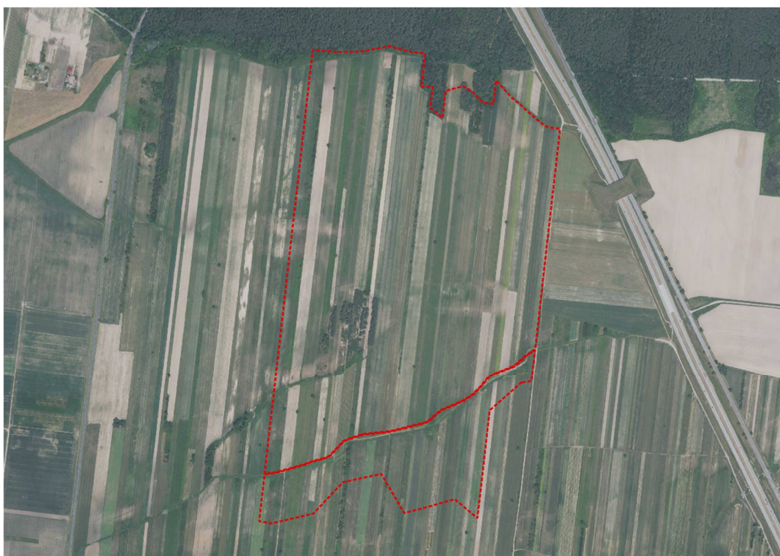
Ryc. 5 Obszar opracowania w miejscowości Osiny