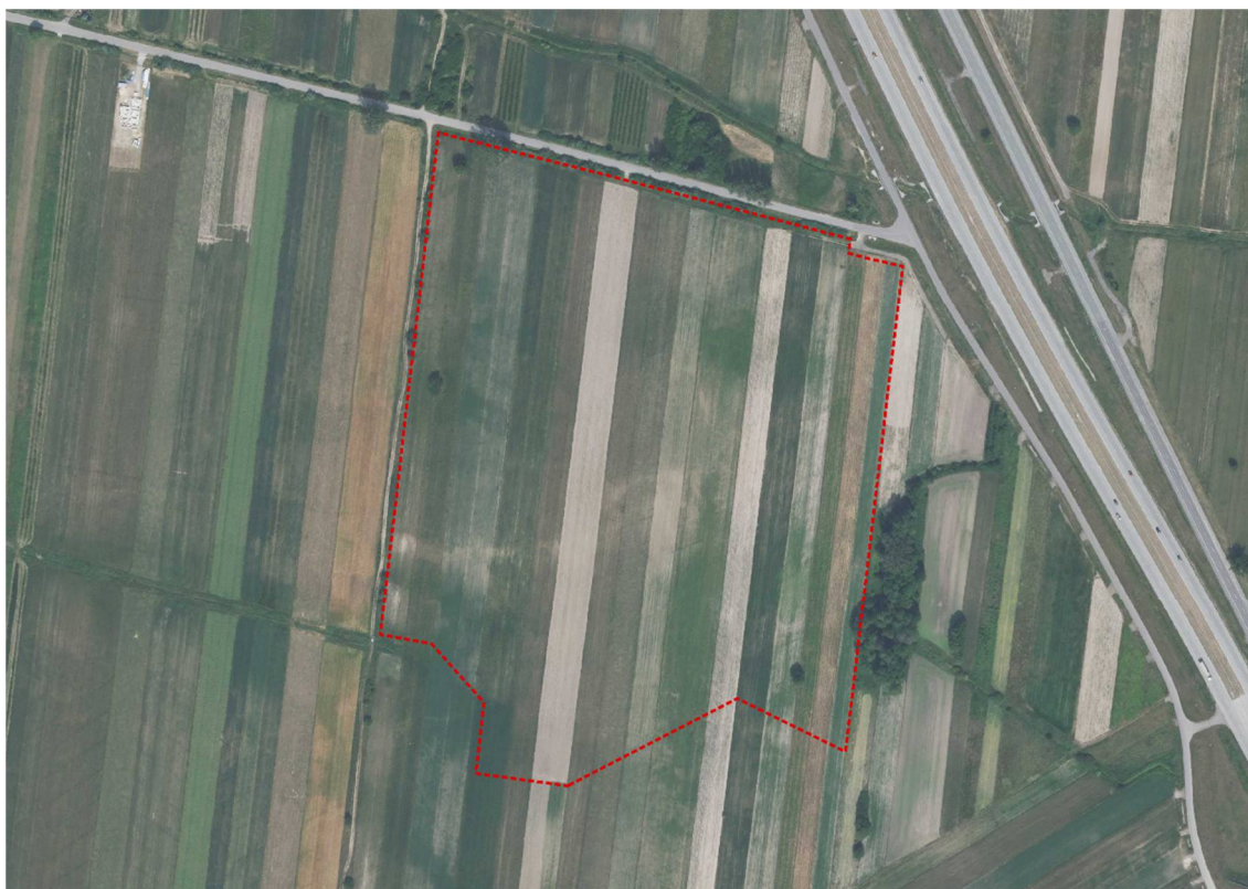
Ryc. 6 Obszar opracowania w miejscowości Wola Osińska

Żyrzyn to gmina wiejska, o niskiej gęstości zaludnienia. Według ostatnich badań gminę zamieszkuje 6091 osób (GUS 2023). Osadnictwo w gminie wykazuje pewne zróżnicowanie pod względem układu przestrzennego, co związane jest z warunkami topograficznymi, gruntowo-wodnymi oraz społeczno-gospodarczą genezą jego powstania. Na analizowanych obszarach znajdują się głównie grunty orne, wykorzystywane rolniczo.