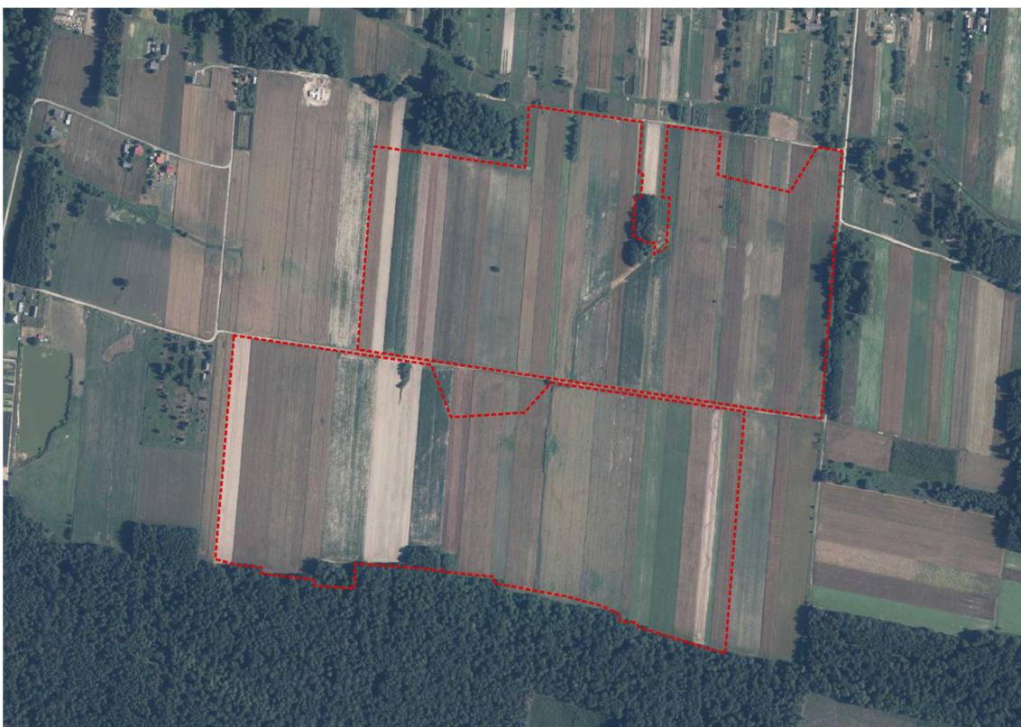
Ryc. 3 Obszar opracowania w miejscowości Zagrody