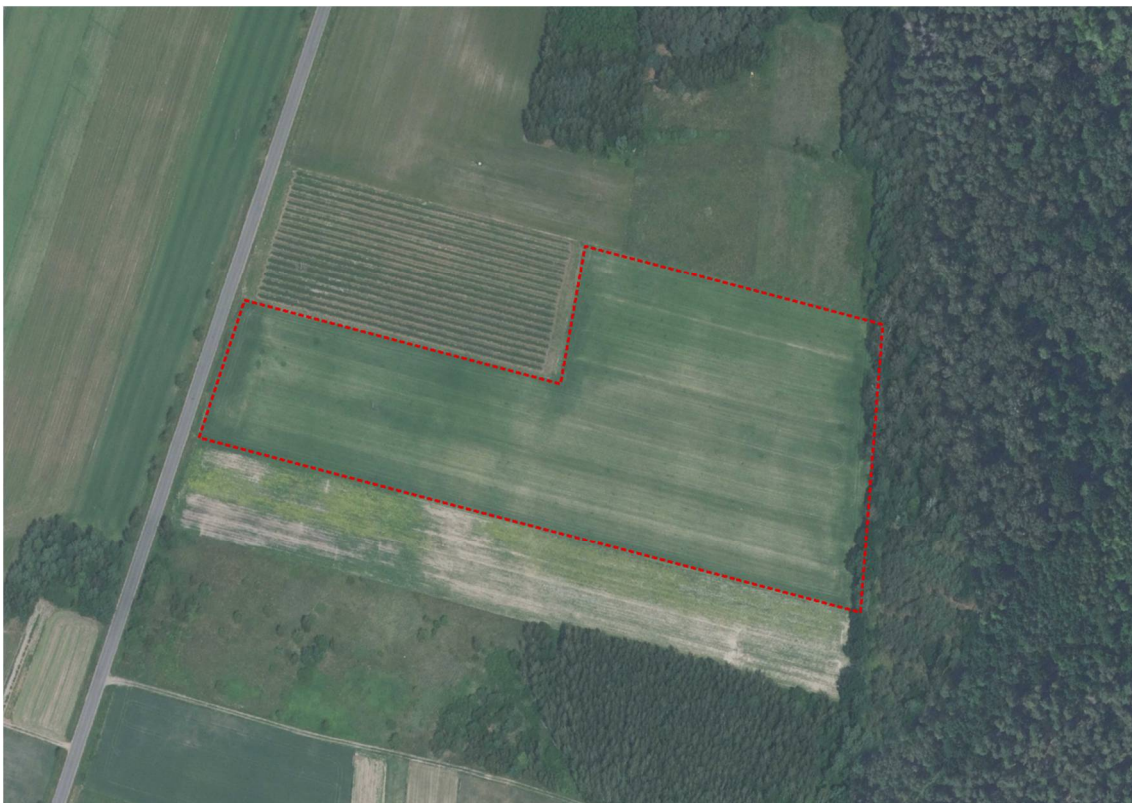
Ryc. 2 Obszar opracowania w miejscowości Żerdź